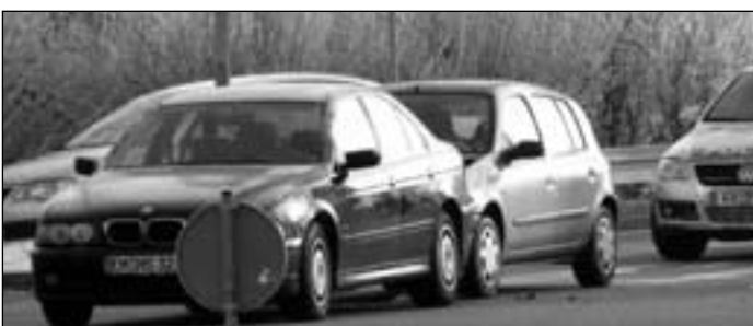
Nur Blechschaden heute Morgen kurz nach 11 Uhr bei der Einmündung nach der Freiburger Brücke in die Romaneistraße

dazu natürlich verschiedene heiße Variationen von Glühwein und Cocktails. Gefeierte werden darf bis 2 Uhr!