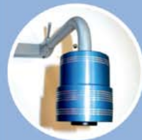
Kamera drehbar, LED Beleuchtung, bis 50-fache Vergrößerung