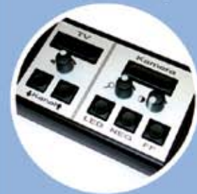
Große, einfache Fernbedienung für alle Funktionen