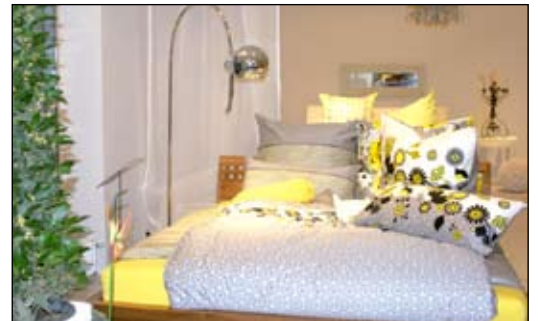
Blick in den neu gestalteten Ausstellungsraum