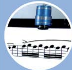
Autofocus 6- bis 50-fach