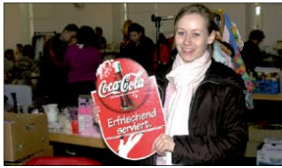
Der Flohmarkt am Samstag in der Steinhalle hätte nach Angaben der Aussteller mehr Besucher vertragen können!