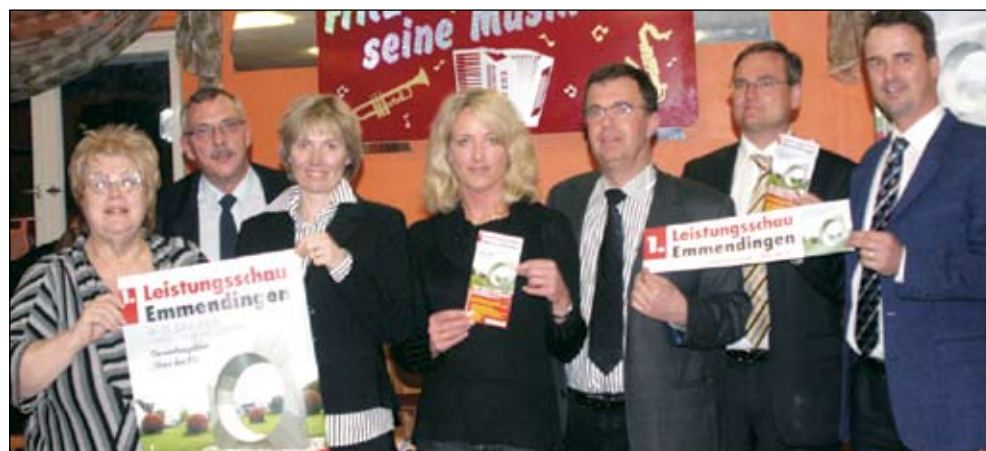
Gestern Abend präsentierte das Orgateam zur Vorbereitung der 1. Emmendinger Leistungsschau das Werbematerial für die am 14./15. Juni geplante Leistungsschau. Die Veranstaltung im „Sportjournal“ war erneut bestens besucht. Lesen Sie Seite 6!

Mehr zu den Gesundheitstagen auf unseren Sonderseiten EM-EXTRA-Kompakt zum Herausnehmen!