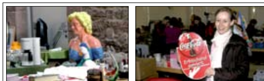
Der Hohmarkt am Samstag in der Steinhalle hätte nach Angaben der Aussteller mehr Besucher vertragen können!