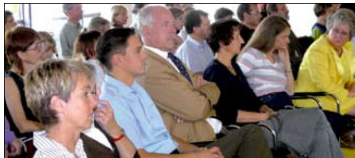
Unter den Besuchern auch Stadträte verschiedener Fraktionen.

mendingens vermittelt wurde. Leben, lernen und arbeiten in Emmendingen – unter diesen Begriffen konnte man die Themen einordnen. Statistische Zahlen, Partnerschaften, Vereine, Schulen, Wirtschaft, Geschichte, Sehenswürdigkeiten, Umgebung, Veranstaltungen, Städtische Unternehmen, Kultur, Märkte und Feste wurden beleuchtet. Und gar mancher der „Altbürger“ im Saal freute sich über die attraktive Präsentation der Stadt und die anerkennenden Kommentare der „Neuen“, die Emmendingen durchweg echte Lebensqualität bestätigten.