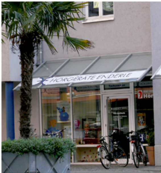
Hörgeräte Enderle, Cornelia-Passage in Emmendingen

in meiner Laufbahn als Hör- so manche Innovation im Hör- aber Epoq ist wirklich etwas mich war sofort klar: Dieses müssen meine Kunden testen. das Leben vieler Hörgeräte- positiv verändern und dank dezenten Designs ist Epoq mit Sicherheit auch die schönste Hör- findung der Welt“, schwärmt Enderle-Ammour. Bis zum 10.2007 können Sie Epoq, neue Epoche des Hörens, in Filialen von Hörgeräte le unverbindlich und kos- ten.