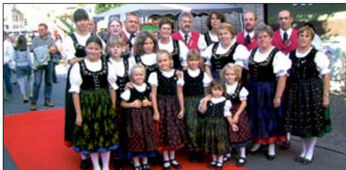
Tänzer der Niederremmendinger Trachtengruppe