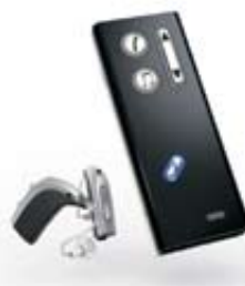
Epoq-Hörsystem mit Streamer

„Wenn ich es nicht selbst getestet hätte, würde ich es nicht glauben. Ich trage Epoq jetzt erst seit knapp einer Woche und kann es kaum erwarten, wieder mit meiner Tochter zu telefonieren. Das Handy klingelt direkt in meinem Epoq-Hörsystem. Mit einem einzigen Knopfdruck auf den Streamer nehme ich den Anruf an und konzentriere mich nur noch auf das nette Telefonat mit meiner Tochter. Sie glauben gar nicht, wie viel mir das bedeutet!“