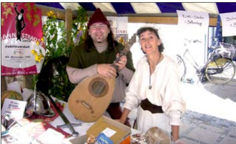
Akteure des historischen Endinger Stadtspiels „Sag, wem gehört die schöne Stadt?“