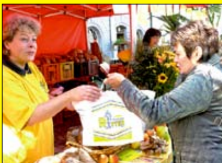
Seit dem ersten Fest dabei: Bäckerei Ritter aus Vörstetten.