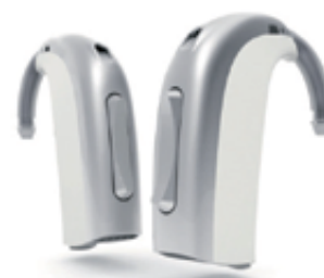
Epoq in platin-weiß

Damit möglichst viele Menschen von der revolutionären Erfindung profitieren, bietet Hörgeräte Enderle jetzt allen Interessierten eine einmalige Aktion an: Testen Sie als einer der Ersten in Emmendingen kostenlos das innovative Epoq-