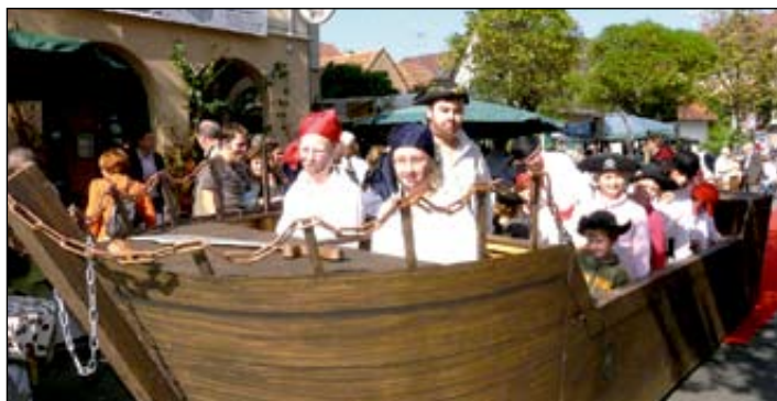
Piratschiff des Theaters im Steinbruch