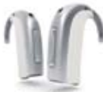
Epoq in platinum weiß

Damit möglichst viele Menschen von der revolutionären Erfindung profitieren, bietet Hörgeräte Enderle jetzt allen Interessierten eine einmalige Aktion an: Testen Sie als einer der Ersten in Emmendingen kostenlos das innovative Epoq-