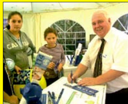
Spaß im Spieleland Müller