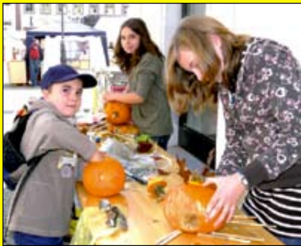
Kürbisschnitzen in der Lammstraße.