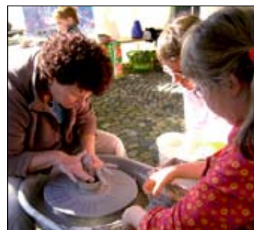
Historische Handwerke Oben: Töpfern, rechts: Drucken auf einer alten Presse von 1921