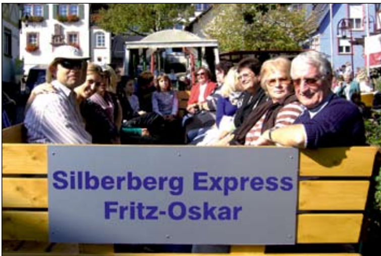
Stimmungsvolle Rundfahrten durch die Bahlinger Weinberge mit dem Silberberg-Express.