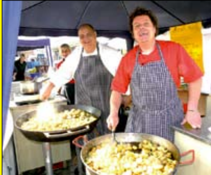
Schmackhaftes beim Team des Schwarzwälder Kartoffelhofs.