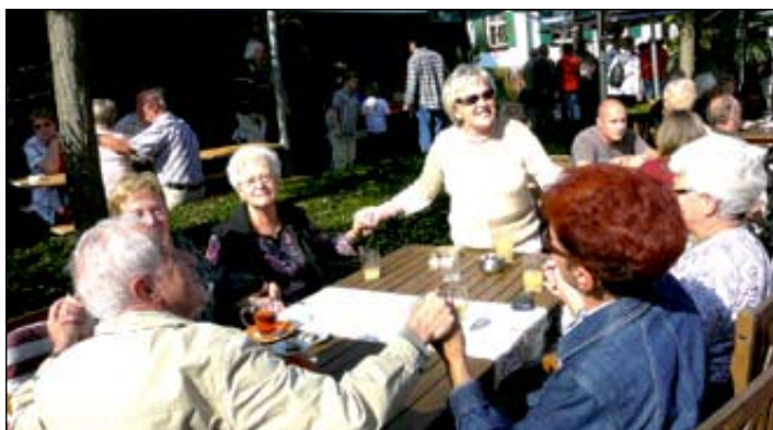
Niederremmendinger in gemütlicher Runde