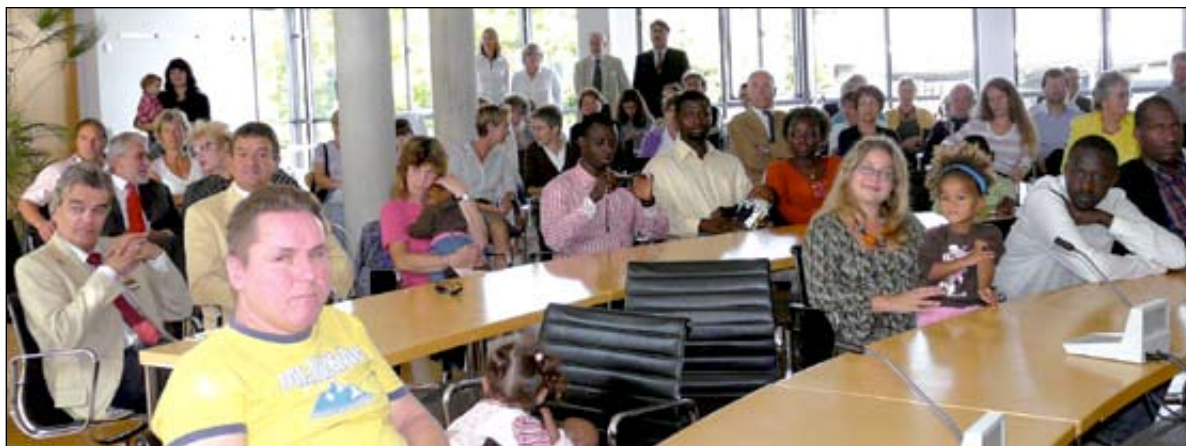
Viele Neubürger waren am Tag der Deutschen Einheit der Einladung der Stadt zum Neubürgerempfang im Sitzungssaal des Rathauses gefolgt.