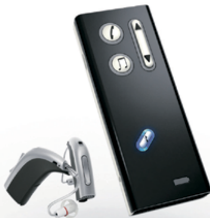
Epoq-Hörsystem mit Streamer

elbst getestet hätte, würde ich rage Epoq jetzt erst seit knapp es kaum erwarten, wieder mit fonieren. Das Handy klingelt Hörsystem. Mit einem einzigen reamer nehme ich den Anruf an nur noch auf das nette Telefonat ie glauben gar nicht, wie viel