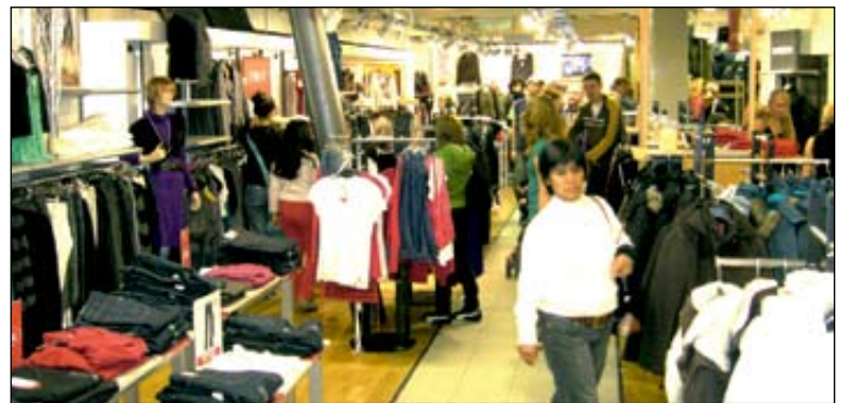
Die Endinger Geschäfte luden zu einem gemütlichen Bummel ein.

anboten. Auch die Endinger Vereine waren auf dem Herbstmärkt vertreten. Trotz des großen Betriebes herrschte an keiner Stelle dringvolle Enge, vielmehr konnte man gemütlich Bummeln und dabei die vielen verschiedenen Eindrücke auf sich wirken lassen. Endingen bewies an diesem Tag wieder einmal, dass es ein besonderes Flair besitzt!