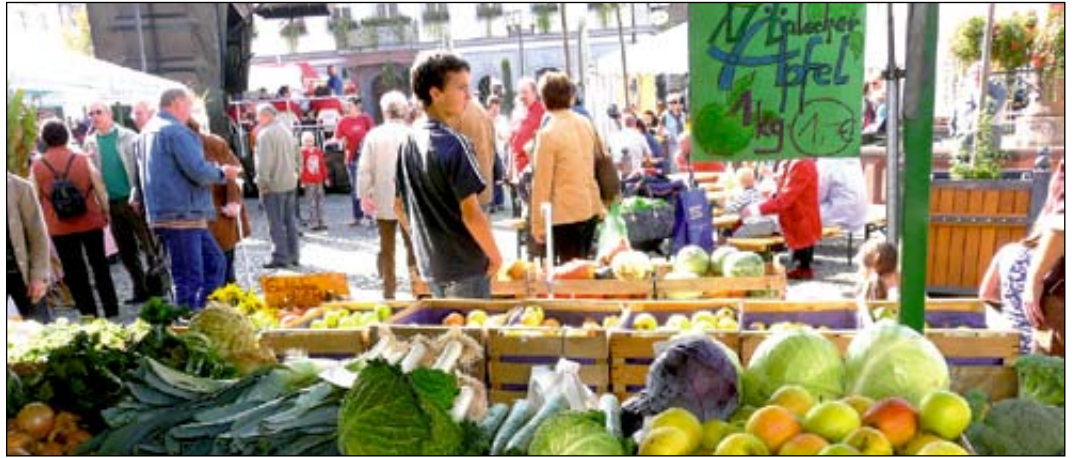
Oben und unten links: Buntes Angebot auf dem Bauernmarkt. Unten rechts: Begehrte war die Kartoffelsuppe im Anwesen Leonhardt.