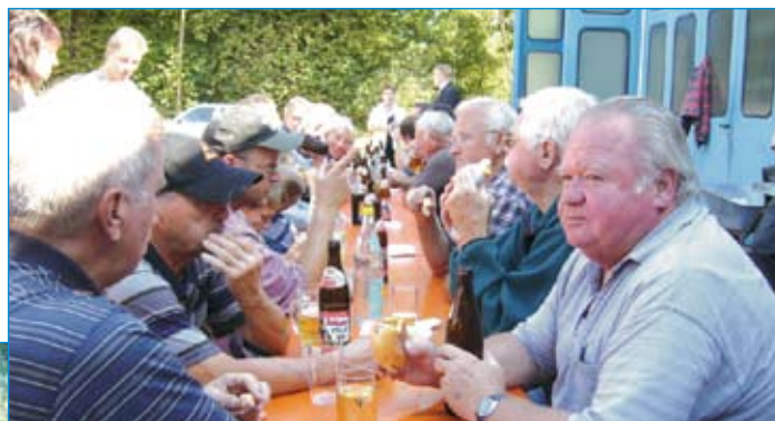
Bild unten: Bei der Fritz-Boehle-Halle war ein Bagger notwendig, um den angesammelten Müll, darunter viele Fahrräder, aus dem Mühlbach zu bekommen.

Bild rechts: Nach Abschluss der Bachputzete ließen sich die Helfer das Vesper schmecken.