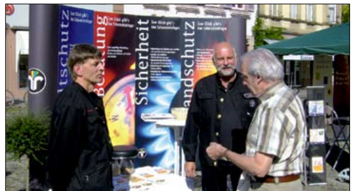
Energieberatung am Stand der Schornsteinfeger-Innung.