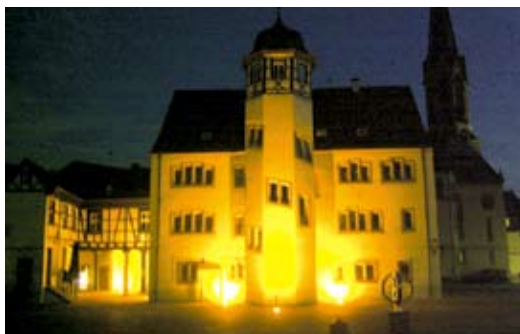
Bild oben: Der Fachwerkaufsatz des Turmes wies die stärksten Schäden auf.

Bild unten: Nachts sorgt das neue Beleuchtungskonzept für stimmungsvolle Effekte.