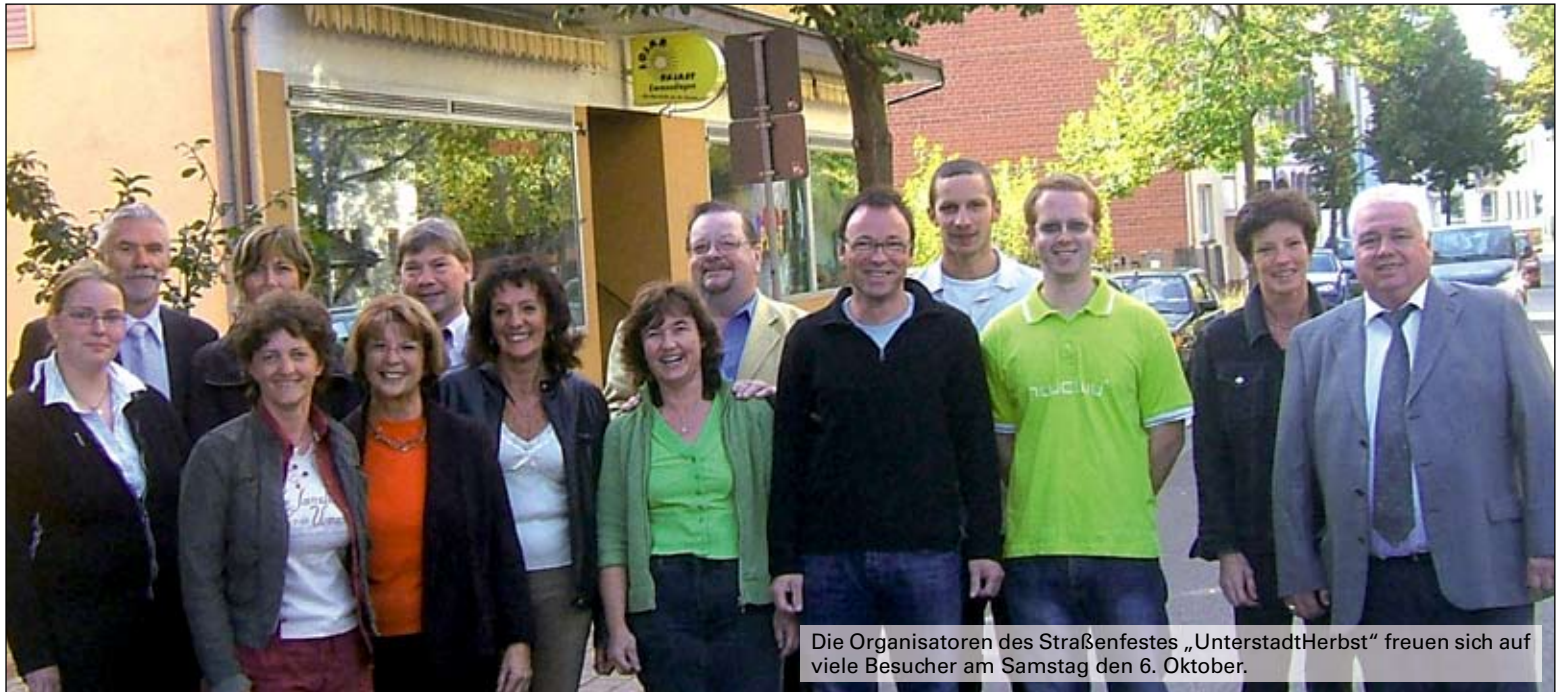
Die Organisatoren des Straßenfestes „UnterstadtHerbst“ freuen sich auf viele Besucher am Samstag den 6. Oktober.

Nach dem großen Erfolg vor zwei Jahren planen ansässige Unternehmen und Vereine in der Unterstadt für den 6. Oktober nun die zweite Auflage dieses volkstümlichen Straßenfestes.