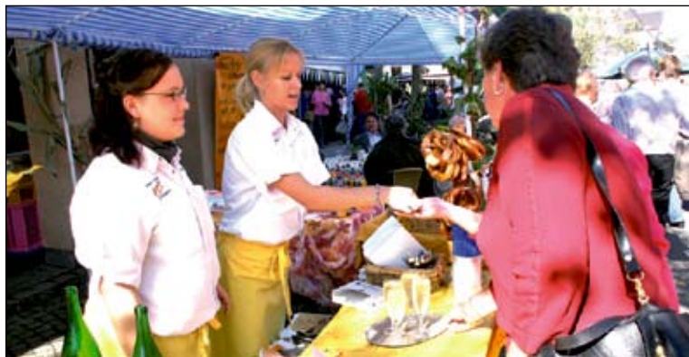
Nicht nur „Unterstädtler“ traf man vor zwei Jahren bei der Premiere des Festes in der Mundinger Straße.