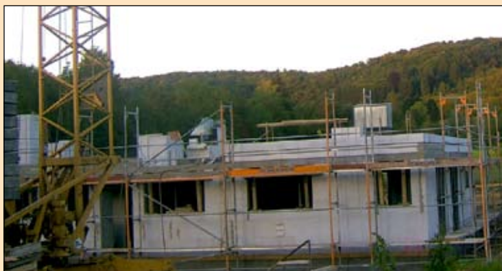
Mitte Oktober wird im „Garten am Kastelberg“ Richtfest gefeiert.