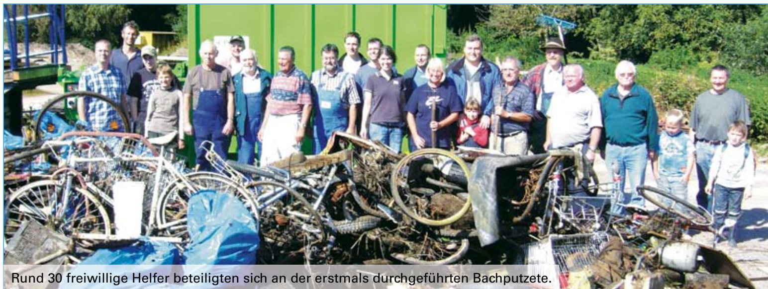
Rund 30 freiwillige Helfer beteiligten sich an der erstmals durchgeführten Bachputzete.