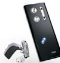
Epoq-Hörsystem mit Streamer

„Wenn ich es nicht selbst getestet hätte, würde ich es nicht glauben. Ich trage Epoq jetzt erst seit knapp einer Woche und kann es kaum erwarten, wieder mit meiner Tochter zu telefonieren. Das Handy klingelt direkt in meinem Epoq-Hörsystem. Mit einem einzigen Knopfdruck auf den Streamer nehme ich den Anruf an und konzentriere mich nur noch auf das nette Telefonat mit meiner Tochter. Sie glauben gar nicht, wie viel mir das bedeutet!“