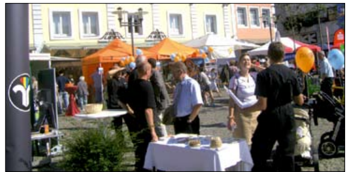
Das vielfältige Informationsangebot beim Energietag auf dem Emmendinger Marktplatz stieß auf großes Interesse.