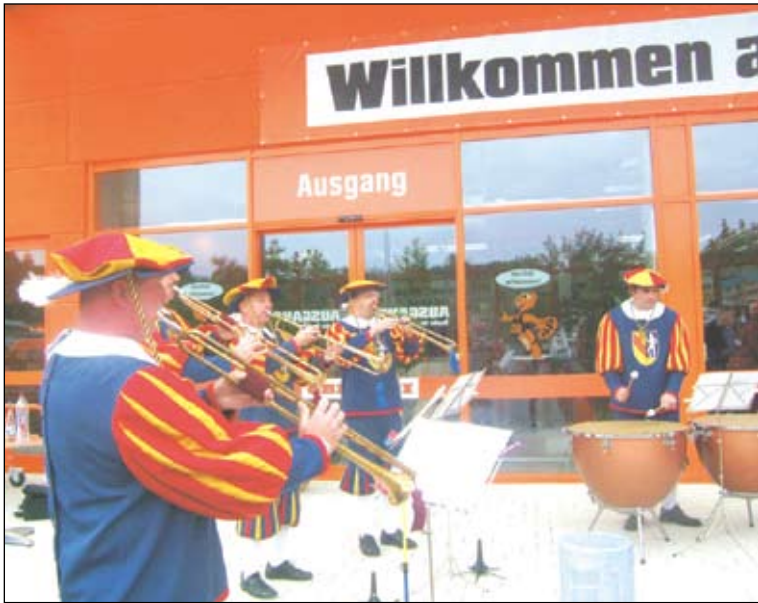
Das Barockensemble der Hachberger Herolde begrüßte die Ehrengäste.