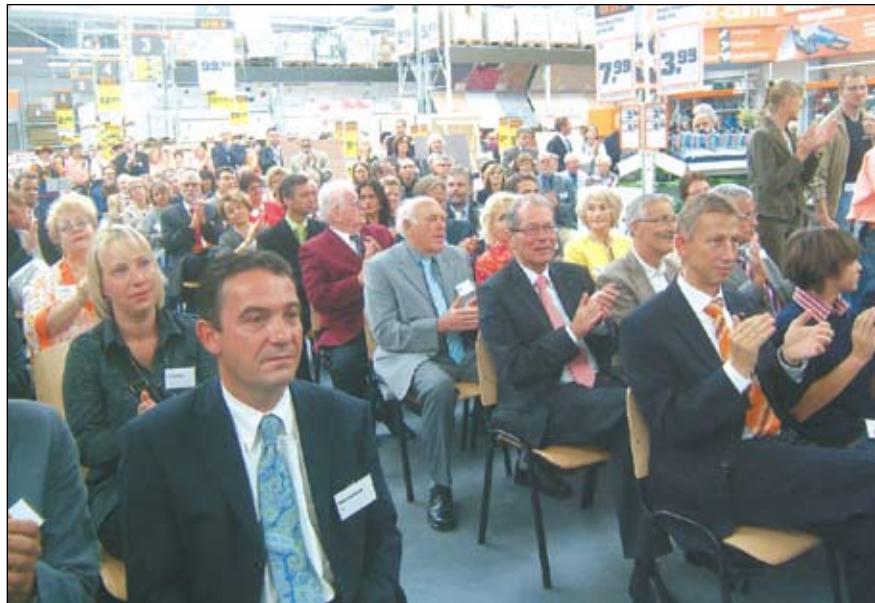
Gäste aus Politik und Wirtschaft waren am Sonntag zur Eröffnung geladen.