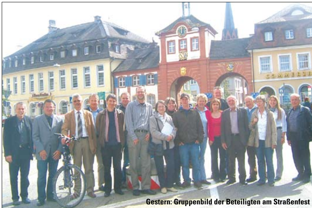
Gestern: Gruppenbild der Beteiligten am Straßenfest

Das Programm auf den Bühnen reicht von Blasmusik über Rock und Jazz bis hin zu Tanz, Artistik und Clownerei. Fortsetzung auf Seite 6.