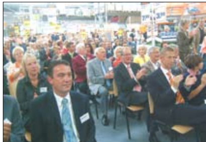
Gäste aus Politik und Wirtschaft waren am Sonntag zur Eröffnung geladen.