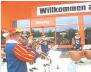
Das Barockensemble der Hachberger Herolde begrüßte die Ehrengäste.