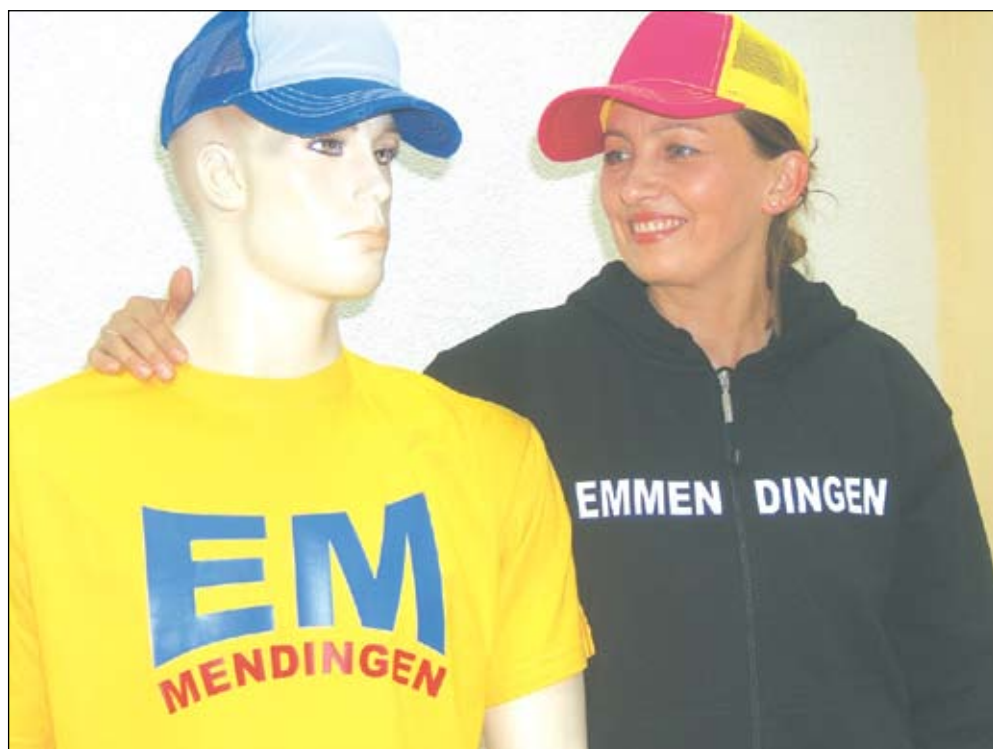
Emmendingen zeigt sich! Sie ist da: Die EM-EXTRA -Stadtkollektion. Wo Sie ab sofort die Shirts und Jacken mit dem Aufdruck Emmendingen erhalten, erfahren Sie auf Seite 20.

Postfach 1312, 79303 Emmendingen E-Mail: em-extra@web.de Tel. 07641 - 9597527 Fax 07641 - 9330912