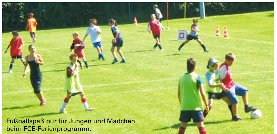
Fußballspaß pur für Jungs und Mädchen beim FCE-Ferienprogramm.