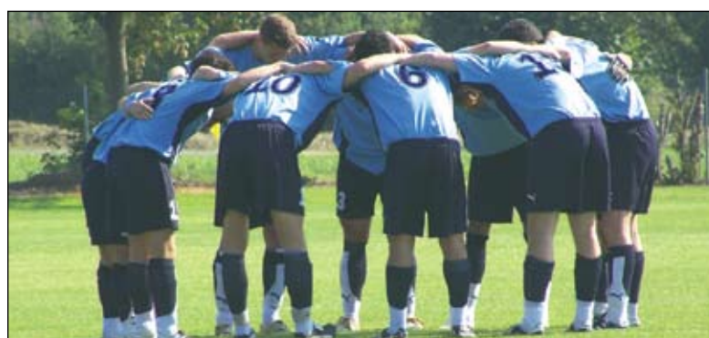
Auch das gemeinsame Einschwören brachte nichts! Pokalaus für die SG Wasser/Kollmarsreute.

Am kommenden Wochenende müssen die Spieler vom ÜTS Emmendingen in der 1. Hauptrunde nun gegen St. Peter ihr Können unter Beweis stellen.