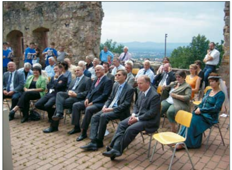
Gäste bei der Unterzeichnung des Pachtvertrags