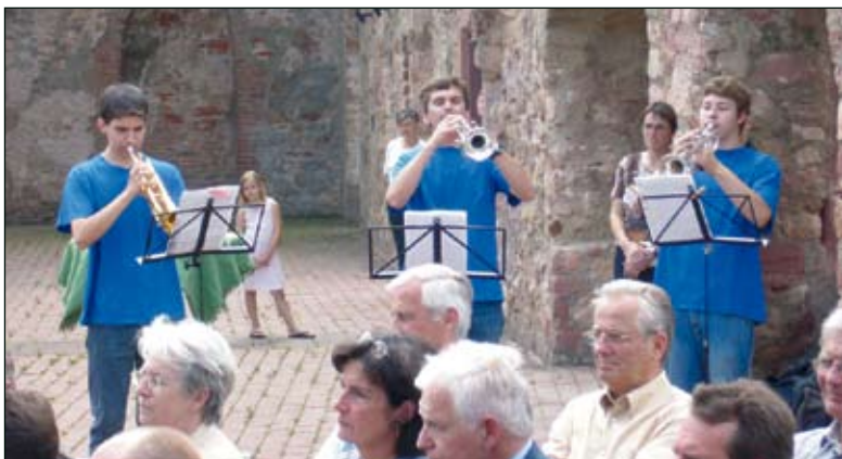
Musiker der Musikschule Nördlicher Breisgau