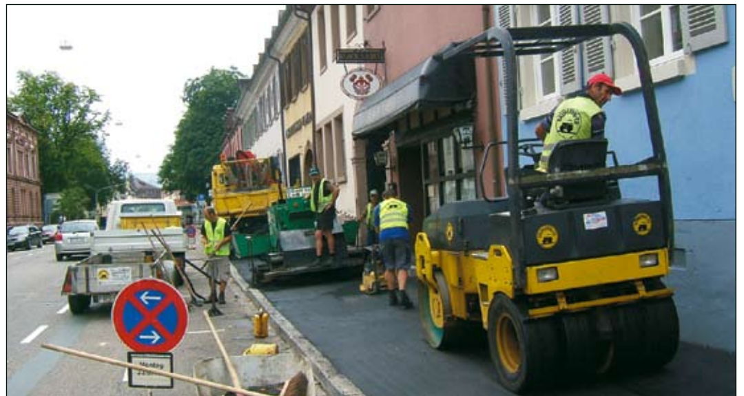
„Festvorbereitungen“ in der Karl-Friedrichstraße. Rechtzeitig zum Festwochenende Mitte September werden die Gehwege seit gestern neu asphaltiert.

Bei Spielen, Schminken, Tombola oder Feuerwehrauto fahren sollten alle Kinder auf ihre Kosten kommen. Mit der Tanzkapelle Malayka klingt das diesjährige Waldfest aus. Die vielen Helfer des Musikvereins haben wieder ein reichhaltiges Getränke- und Speiseangebot zusammengestellt. Außerdem ist an allen drei Festtagen die Kaffeestube, die Cocktailbar und die Bar geöffnet.