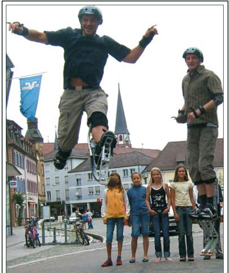
Große Sprünge in der Innenstadt: Ein Hingucker am Rande des Speedsoccerturniers auf dem Marktplatz waren diese beiden „Powerriser“-Sportler. Der neue Trendsport mit den gefederten Sprungschuhen findet auch in Südbaden immer mehr Anhänger.